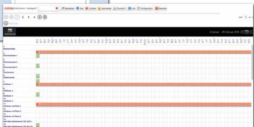
Übersicht der Zeiten